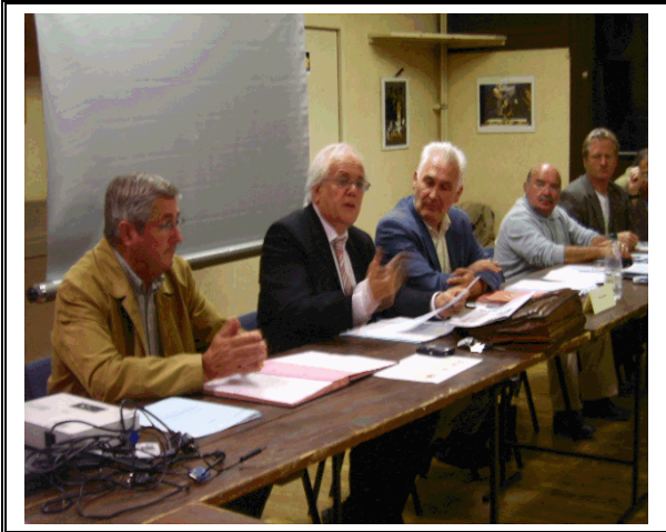
Le Président du Conseil Général en visite à la CCBB lors du dernier Conseil Communautaire