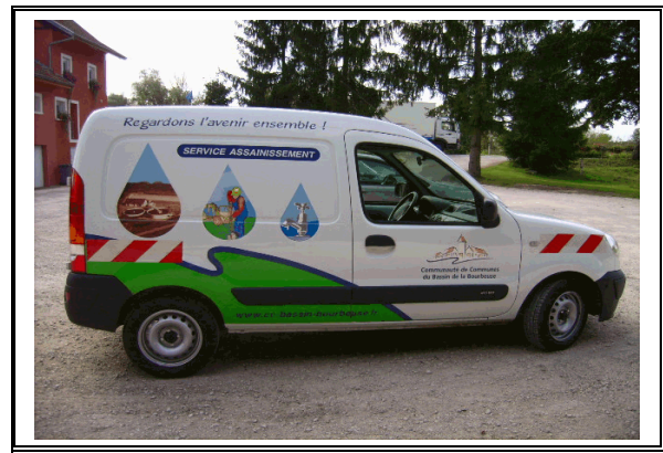
Un des véhicules du Service Assainissement

Nos missions de service public s'articulent principalement autour de l' Eau : son captage , sa distribution et son traitement : les trois gouttes d'eau symbolisent ces trois domaines