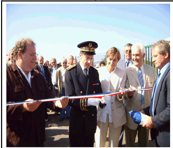
La traditionnelle coupe du ruban tricolore par M. le Préfet du Territoire de Belfort

Cette station d'épuration est classique sur son mode de traitement des effluents, de type boues activées. Par contre, elle innove totalement sur le principe de traitement des boues qui en sont issues : une serre de séchage solaire permet de transformer les boues d'un état semi liquide à un état solide (granulés) permettant ainsi un choix élargi parmi les différentes filières de valorisation.